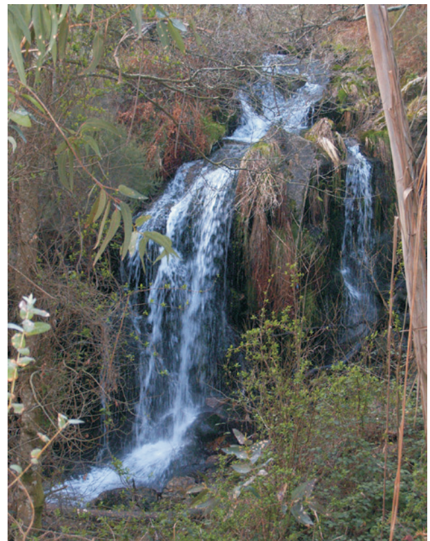
Rego dos Mouros

Pola estrada de Poio á Escusa crúzase o río e cara abaixo están os saltos e uns muíños abandonados. O acceso é complicado por estar cheo de mato.